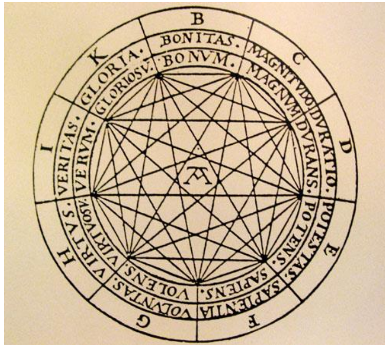
Detalle de la figura A y los nueve principios absolutos o dignidades

Llull identifica a Dios con el primer Principio de toda la realidad, la plenitud del Ser que la razón humana puede comprender, al menos, en sus aspectos fundamentales. Para Llull, dicho Principio se ha revelado a sí mismo a la inteligencia humana en sus trazos fundamentales, es decir, a través de las dignidades. En la última redacción del Arte (Ars ultima) , dichas dignidades son nueve y son representadas cada una con las letras B, C, D, E, F, G, H, I, K. Cada letra, principio o dignidad simboliza una idea básica susceptible de ser atribuida a la esencia divina en forma absoluta. Ahora bien, toda vez que estos principios no introducen en la esencia divina pluralidad alguna, se da una perfecta conversión o identidad efectiva de dichos principios entre sí, e igualmente entre ellos y la esencia de Dios.