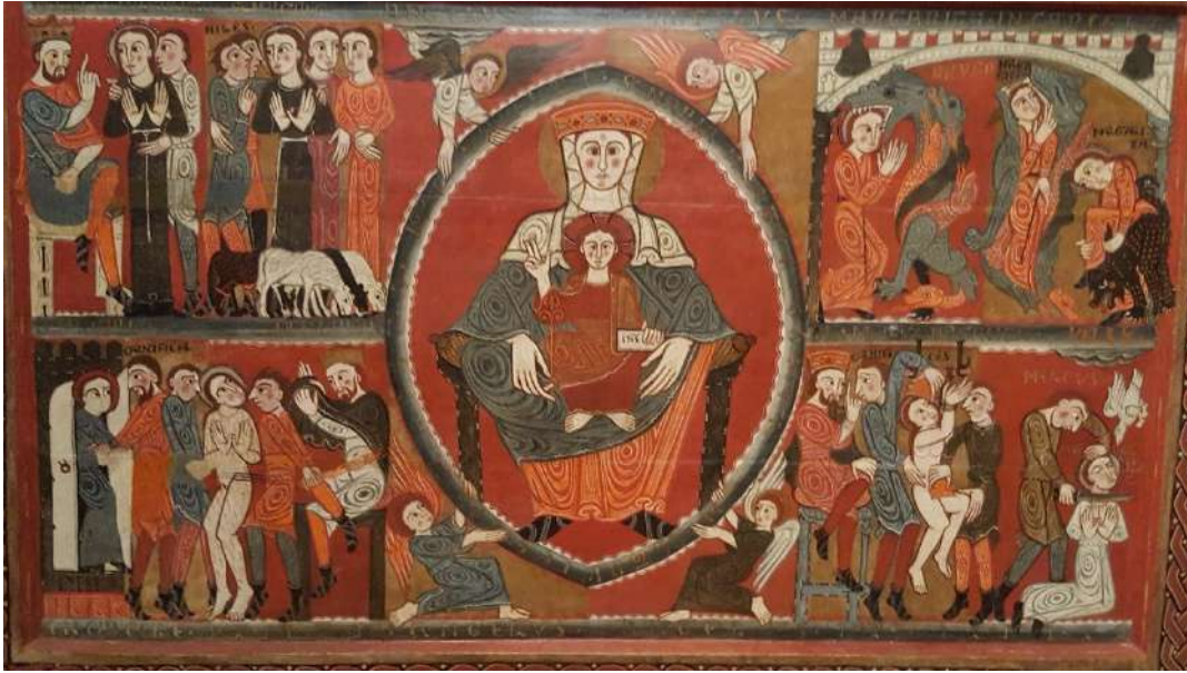
Segunda mitad del siglo XII: el frontal del altar du couvent de Santa Margarida de Vilaseca, L'Esquirol (Osona)

Este frontal del altar del convento de monjas de Santa Margarida de Vilaseca es probablemente el trabajo de un taller de Vic de la segunda mitad del siglo XII. En el siglo XIV es traído a Vic, cuando las religiosas van a ocupar un nuevo convento que más tarde será el de los trinitarios descalzos. La Virgen y el Niño incluidos en la mandorla que figura sobre el frontal del altar se encuentran protegidos, como dentro de una almendra. La blancura de sus rostros y del velo de la Virgen, tendido sobre sus hombros, forma un sistema dual con el rojo del interior de la mandorla, de la aureola y de la túnica del Niño divino, lo que señala la última etapa de la transmutación de la materia original en la economía de la salvación. La materia, tras su estado original de negrura, pasa, en efecto, por el blanco antes de la esperada salida del sol, la aureola dorada de la Virgen, que corresponde a la elevación del fuego hasta su más elevada intensidad. 20 Los colores de los cuatro ángeles, sobre un fondo dorado o rojo, que sostienen la almendra de la mandorla podrían ser los de los cuatro elementos: la tierra, el agua, el aire y el fuego. Pero ¿no podría la almendra ser también un huevo, el huevo filosófico, es decir el vaso alquímico, el huevo que protege la vida y el ser y anuncia la venida de la estrella? 21