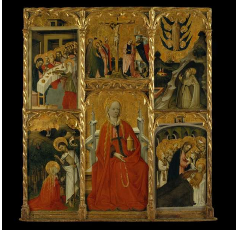
Hacia 1450: retablo de santa María Magdalena de Perella, de la iglesia de Santa Magdalena de Perella, San Joan de les Abadesses (Ripollès)

Magdalena, «apóstol de los apóstoles» según el dominico Santiago de la Vorágine, autor de la célebre Leyenda dorada hacia 1260-1270, es, sin duda, la mujer más importante de la historia de los orígenes cristianos después de la Virgen Madre de Dios.