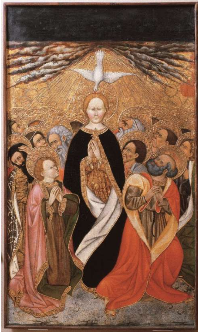
Entre 1432 y 1434: Retablo de Santa Maria de Verdú (Urgell)

El suelo desnudo, mineral y estéril, simboliza la condición del hombre, tras el pecado original que lo apartó del hermoso jardín del paraíso terrenal, pero también es el lugar donde los ermitaños acceden a la salvación. Llama la atención que se distingan doce piedras, en cuatro grupos de tres, como los doce apóstoles que rodean a la Virgen. Por delante del radiante río dorado destaca la impassible cabeza rubia de la Virgen de Pentecostés, aureolada de oro, tocada en lo alto por el pico ardiente de la paloma del Espíritu, que constituye de este modo el vértice de otro triángulo donde se inscriben todos los personajes. Porque María también nació del Espíritu y concibió por el Espíritu, es la matriz divina, el gran misterio del que nacen todos los seres, el espejo de la Trinidad, recuerdan los alquimistas. El triángulo femenino duplica y prolonga el triángulo divino. El río o camino de oro aparece, por tanto, entre las espesas nubes grises, como el soplo del viento o el viento mismo, soplo espiritual cuya luz sobrenatural no puede sino eclipsar toda